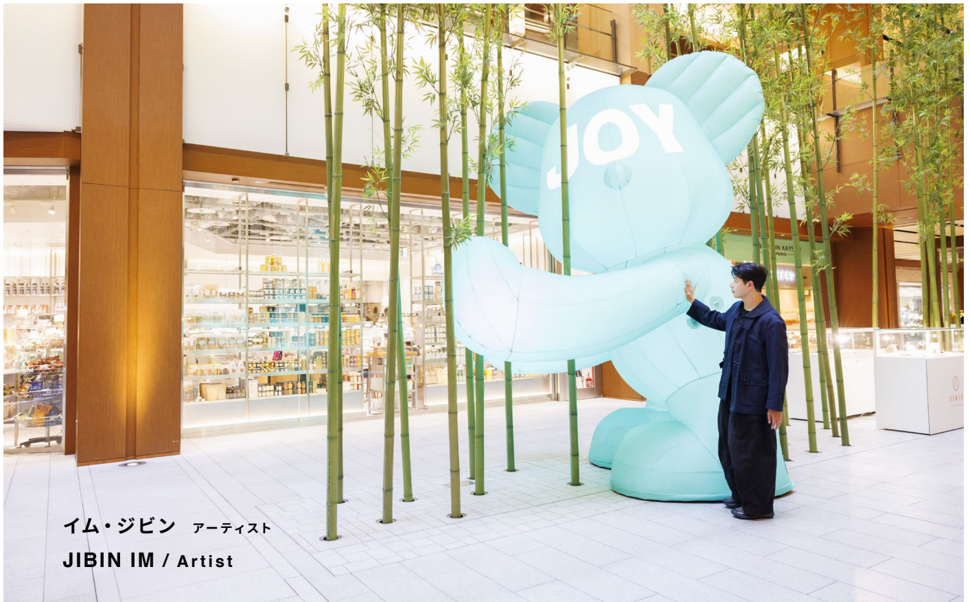
イム・ジビン アーティスト JIBIN IM / Artist

published_2025.10.15 / photo_yoshikuni nakagawa / text_shoko ema