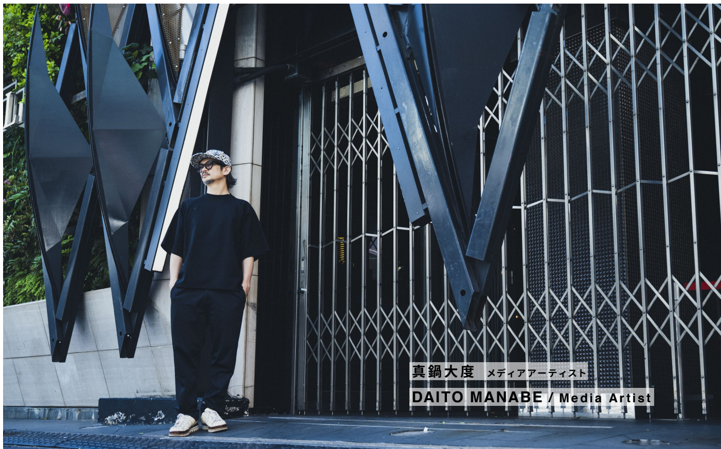
真鍋大度 メディアアーティスト