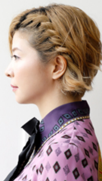
福原志保 バイオアーティスト Shiho Fukuhara / Bio Artist