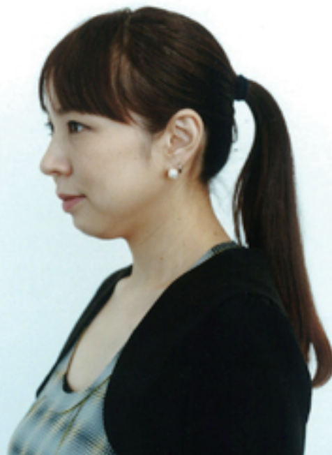
永山祐子 建築家 Nagayama Yuko / Architect